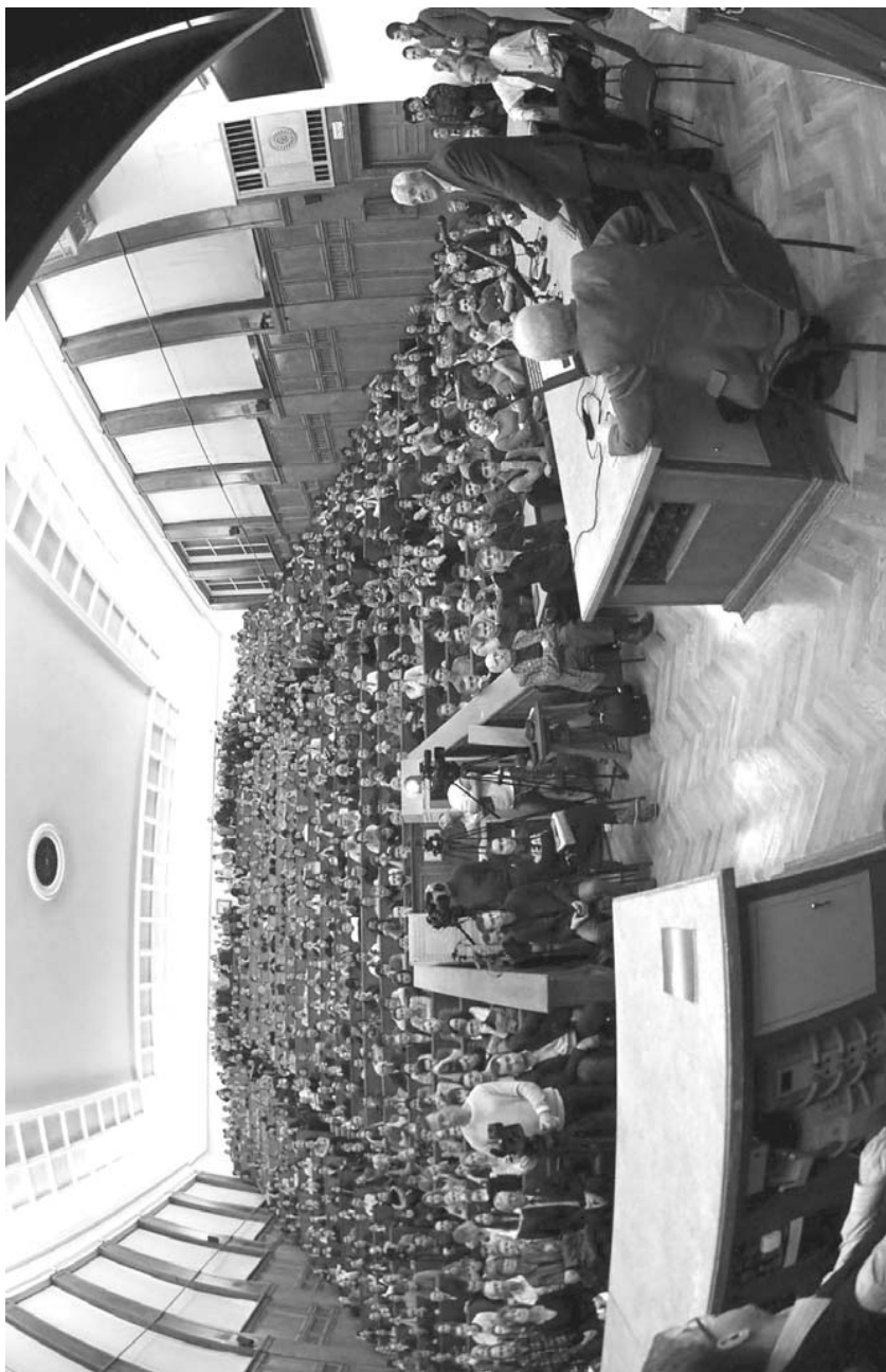
ЦФА была переполнена

Подробности открытия гравитационных волн будут изложены в ближайшем номере «Советского физика».