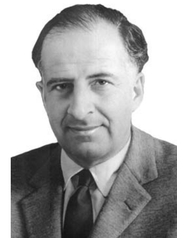
Бруно Максимович Понтекорво

Наступивший 2016 год связан с целым рядом юбилеев. Будет широко отмечаться 2400 лет со дня рождения Аристотеля (384–322 гг. до н.э.). Влияние этого человека на все обла-