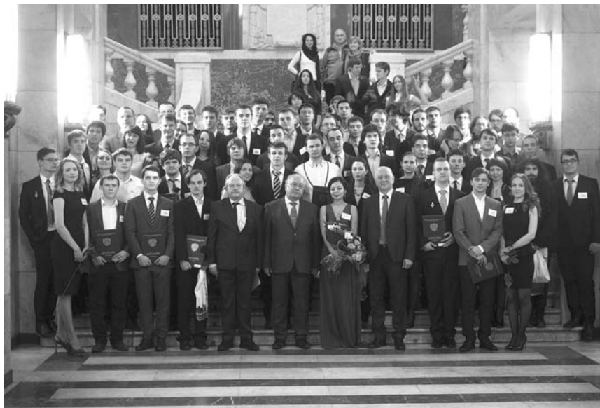
Вручение «красных дипломов» выпускникам 2016 года