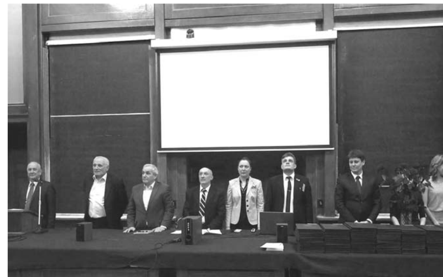
Президиум торжественного заседания Ученого совета физического факультета МГУ, посвященного выпуску молодых специалистов-физиков

В этом году диплома первой степени удостоено 2 человека, дипломом второй — 3, диплома третьей — 4.