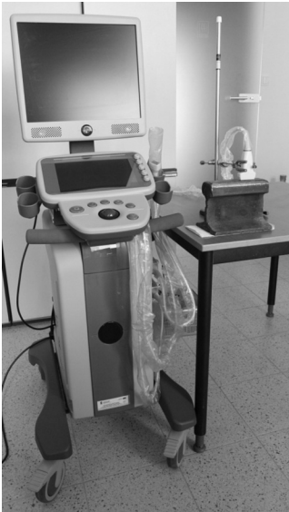
Rys. 1. Widok układu pomiarowego Fig. 1. Meter circuit view

Dane pomiarowe zostały zebrane przy pomocy ultrasonografu badawczego Ultrasonix SonixTOUCH (Kanada). Aparat ten dzięki specjalnemu oprogramowaniu badawczemu umożliwia zaprogramowanie sekwencji nadawczo-odbiorczych oraz akwizycję surowych danych w.cz. z każdego przetwornika. Sygnał ech był próbkowany z częstotliwością 40 MHz i rozdzielczością 12-bit. Zastosowano liniową głowicę ultradźwiękowa o 128 elementach i odległości między przetwornikami (pitch) równej 0,3048 mm. Użyto głowicy o częstotliwości 4,2 MHz, a napięcie nadawcze wynosiło 94 V.